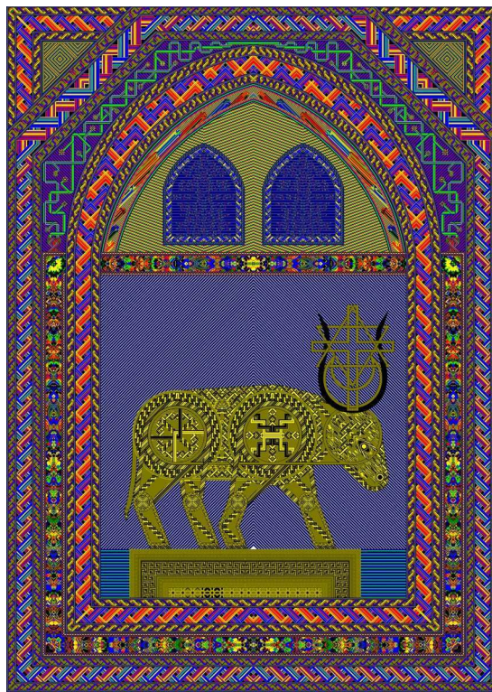
Motiv 2: The Golden Calf, 145x200 cm( i proces)